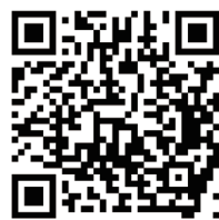
「保安一站通」 流動應用程式