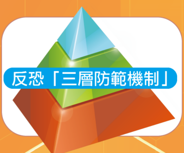
反恐「三層防範機制」

跨部門反恐專責組將繼續積極加強成員部門以至社區不同持份者之間的反恐協調工作，全力配合落實2024年行政長官施政報告中提及的反恐「三層防範機制」，並會透過不同渠道向社會各界加強反恐公眾教育，讓市民了解他們在預防恐怖活動中的角色和責任，以達致「全民反恐」。